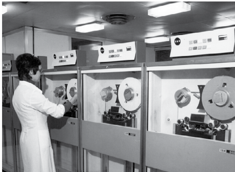
Centro di calcolo Cnuce

Il 30 Aprile 1986 venne stabilito il primo collegamento Internet Italiano.